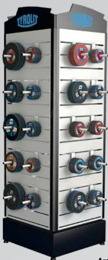
Aranjarea pe podea