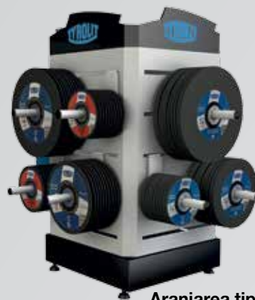
Aranjarea tip ghișeu