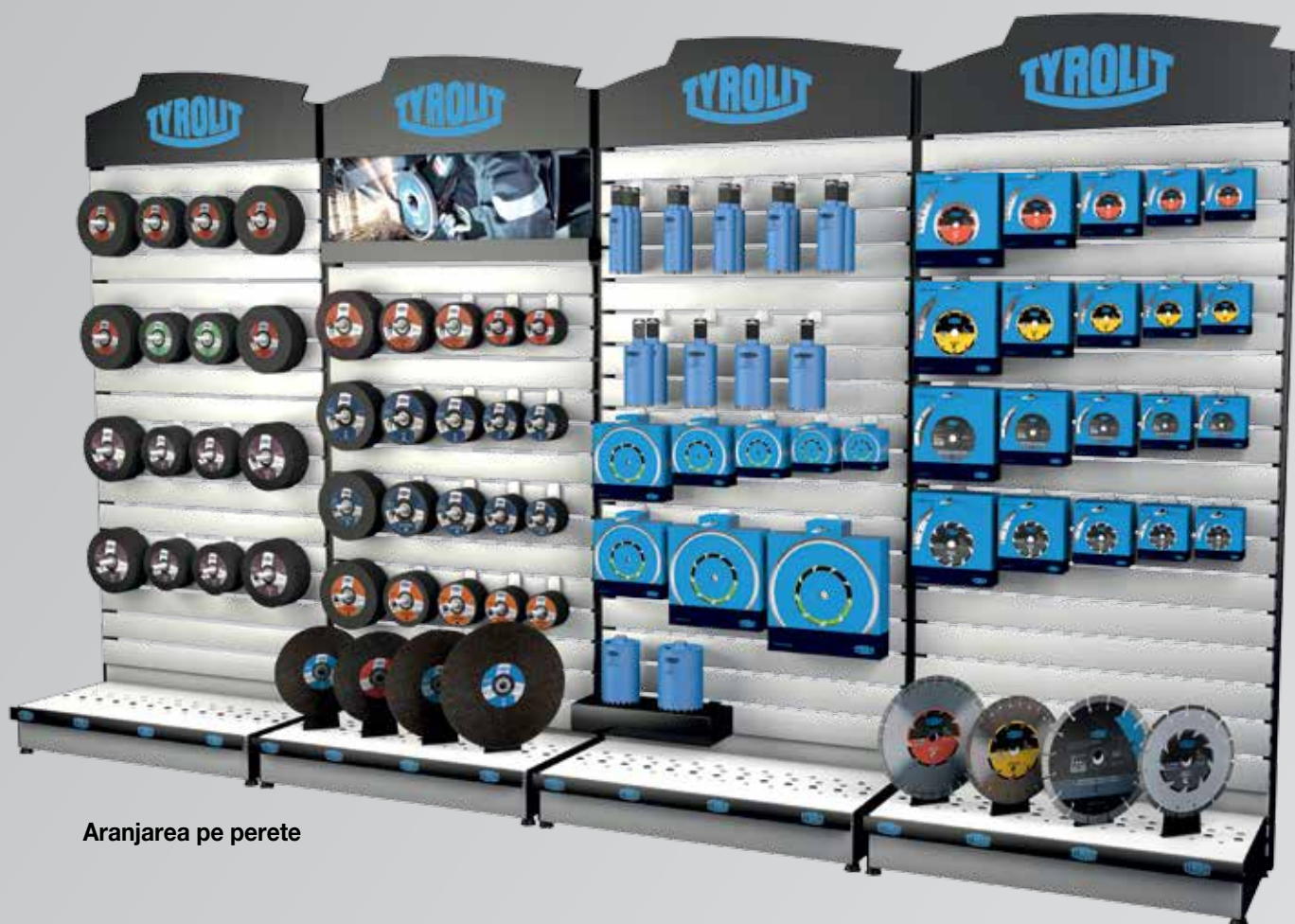
Aranjarea pe perete